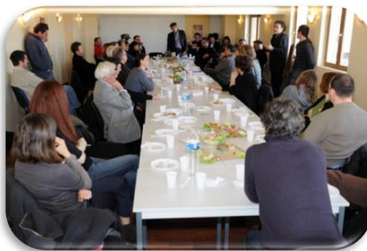
Photo séminaire 2011

Nous aurons l'occasion de présenter l'outil également lors du séminaire 2013 le 11/01. Je vous rappelle ainsi que nous vous attendons ce jour-là.